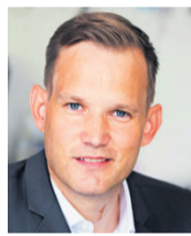
Hendrik Streeck

Herr Streeck, man sieht es ab und zu noch auf der Straße: Ein Großvater, der auf ein Taschentuch spuckt und dem Enkel damit das Gesicht sauber macht. So besonders ratsam ist das nicht, oder? Eines vorweg: Ich sehe nicht alles, was im Leben passiert, durch die Linse des Virologen. Aber grundsätzlich kann man sagen, dass Spucke viele Stoffe enthält, die einen Schutzmechanismus gegen Erreger bilden. Daher ist Spucke generell auch ein Mittel, das antibakteriell wirkt oder das man auf eine Wunde machen kann, wenn gar nichts anderes zur Hand ist. Wichtig ist, dass man seine eigene Spucke benutzt. Wenn eine Oma das macht, kann es durchaus zu einer Infektion kommen.