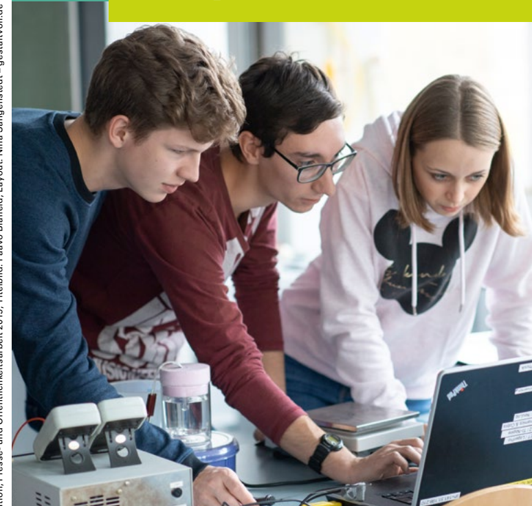
Redaktion: Kommunikation, Presse- und Öffentlichkeitsarbeit 2019, Titelbild: Paavo Bläffeld, Layout: Nina Sengenstedt – gestaltvoll.de