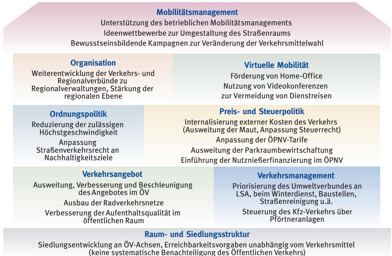
Abb. 2: Handlungsfelder eines integrierten Handlungskonzepts (eigene Abbildung)

Anknüpfend an eine integrierte Push- und Pull-Strategie ist es wichtig, dass Maßnahmen aller unterschiedlichen Handlungsfelder berücksichtigt und kombiniert umgesetzt werden. Dabei verstärkt die Kombination von Maßnahmen gleicher Wirkrichtung ihre Wirksamkeit. Das in Abb. 2 dargestellte Handlungskonzept zeigt die wichtigsten Handlungsfelder mit exemplarischen Maßnahmentypen, die zu einer Reduzierung des Kfz-Verkehr beitragen können. Die genannten Maßnahmentypen beziehen sich dabei auf unterschiedliche Planungsebenen und nicht nur auf die Stadt Kassel.