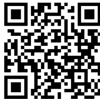
Abb. 3: QR-Code des Klebstoffs Preferre 6182