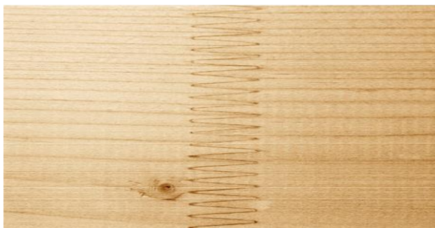
Abb. 2: Verklebte Keilzinkenverbindung

Für den Holzbau sind Klebstoffe nach dem Deutschen Institut für Bautechnik vor allem für die Instandsetzung und die Verklebung tragender Holzbauteile mit und ohne Keilzinkenverbindung und die Verklebung von Holzbauteilen mit Stahlstäben zugelassen. Die zugelassenen Klebstoffe verschiedener Hersteller werden in einer großen Übersichtstabelle aufgelistet. Als Kenngrößen werden Name und Hersteller des entsprechenden Produkts sowie Klebstoffart, Zulassungsnummer, Anwendungsbereich und Haltbarkeit zusammengestellt.