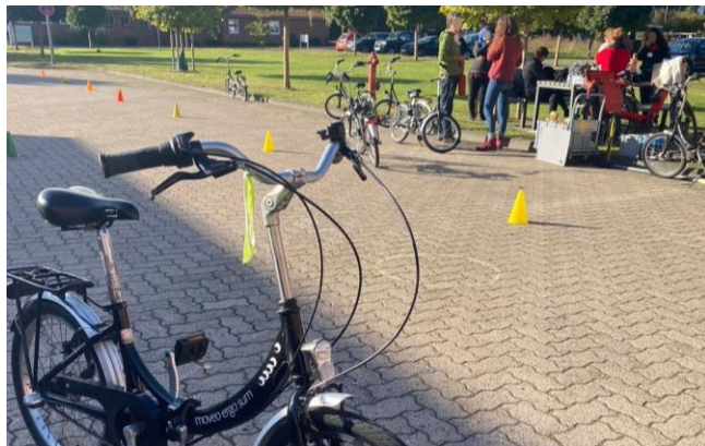
Abbildung 1: Radlernkurs in Empelde, Ronnenberg

Das Projekt wird im Rahmen der Fördermaßnahme „Umsetzung der Leitinitiative Zukunftsstadt“ in der 2. Förderphase (Umsetzungs- und Verstetigungsphase) vom Bundesministerium für Bildung und Forschung (BMBF) gefördert. Projektpartner sind die Region Hannover mit dem Fachbereich Verkehr und dem Dezernat für Soziale Infrastruktur und die Arbeitsgruppe Mobilitätsforschung der Goethe-Universität Frankfurt am Main.