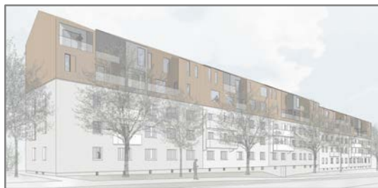
Abb. 2: geplante Aufstockung