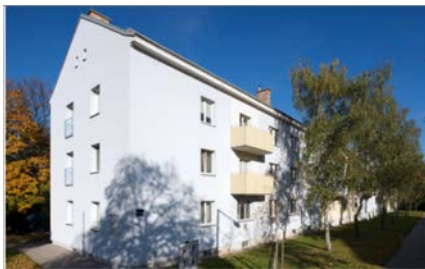
Abb. 1: Ansicht Bestandsgebäude

Im Rahmen eines interdisziplinären Projekts in Zusammenarbeit mit einer Studierendengruppe aus Architektinnen wurde eine Aufstockung für ein Reihenhaus in Wien geplant. Die Planung dieser Aufstockung wurde von proHolz Austria und Wiener Wohnen als Wettbewerb ausgeschrieben. Gemeinsam mit den Architektinnen soll das Tragwerk mit den zugehörigen konstruktiven Leitdetails entwickelt werden.