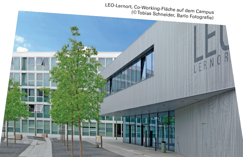
LEO-Lernort, Co-Working-Fläche auf dem Campus

Das Studium bereitet optimal auf die Anforderungen der digitalen Arbeitswelt und die Herausforderungen einer nachhaltigen Transformation von Wirtschaft und Gesellschaft vor.