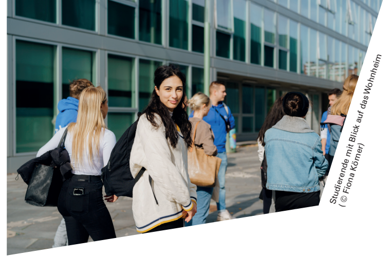
Studierende mit Blick auf das Wohnheim