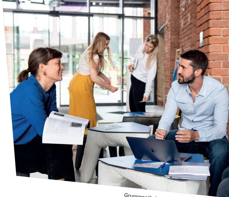
Gruppenarbeit im Studierendenhaus